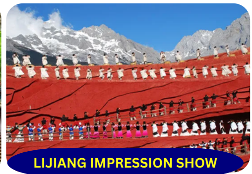
LIJIANG IMPRESSION SHOW