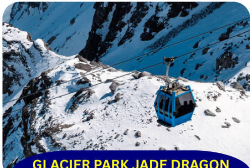
GLACIER PARK JADE DRAGON MOUNTAIN