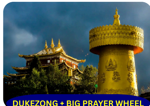
DUKEZONG + BIG PRAYER WHEEL