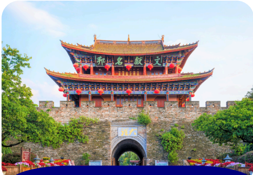
DALI ANCIENT TOWN

Hari ini anda akan melakukan penerbangan menuju Medan (transit Kuala Lumpur) dengan membawa kenangan indah bersama kami~