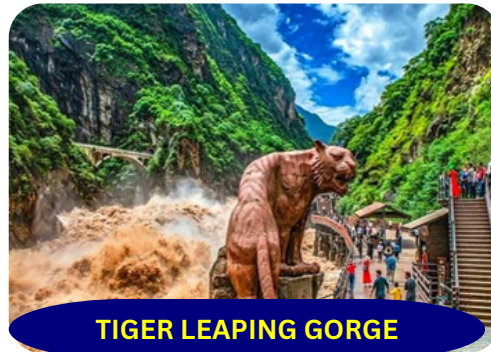
TIGER LEAPING GORGE