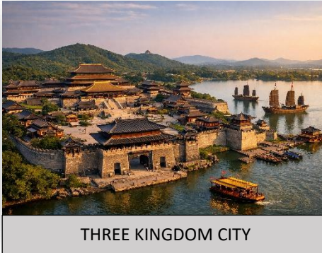
THREE KINGDOM CITY