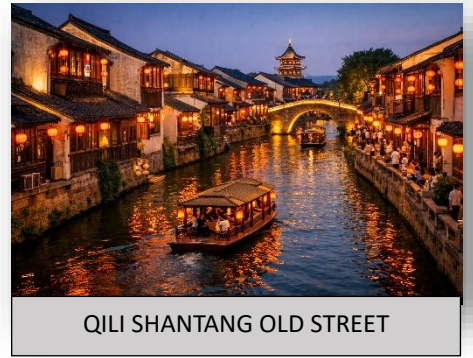
QILI SHANTANG OLD STREET