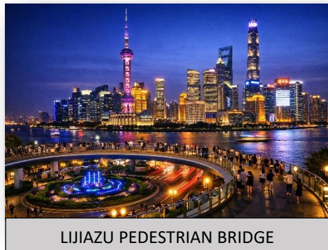
LIJIAZU PEDESTRIAN BRIDGE