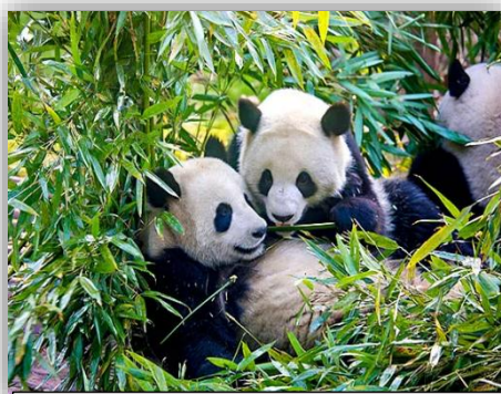
DUJIANGYAN PANDA VALLEY