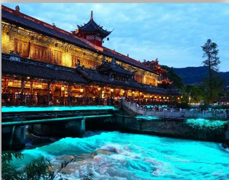
DUJIANGYAN BLUE TEARS