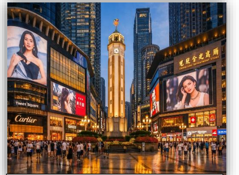
JIEFANGBEI PEDESTRIAN STREET