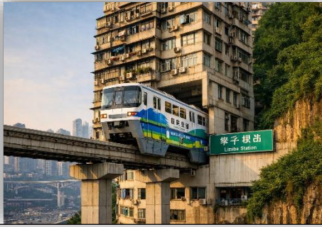
LIZIBA LIGHT RAIL TRACK

Setelah sarapan pagi, rombongan akan ditransfer ke bandara untuk penerbangan kembali ke MEDAN transit melalui KUALA LUMPUR . Setibanya di Kuala Lumpur anda akan menggunakan penerbangan selanjutnya untuk kembali ke kota MEDAN . Acara selesai.