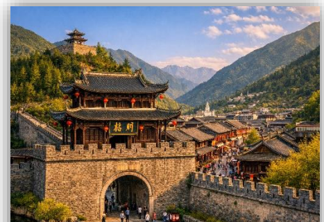
SONGPAN ANCIENT CITY