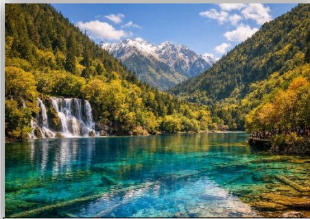
JIUZHAIYOU SCENIC AREA