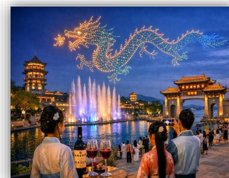
MINGSHUI ANCIENT CITY