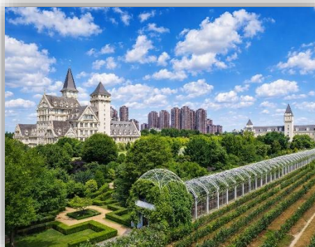
CHANGYU CASTEL WINERY