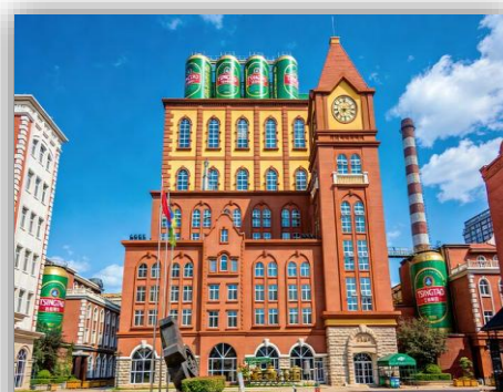
TSINGTAO BREWERY MUSEUM