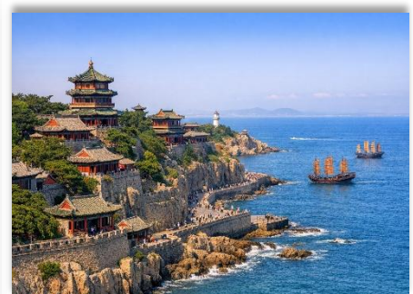
PENGLAI PAVILION SCENIC AREA