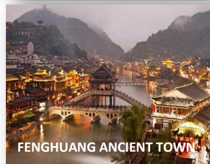
FENGHUANG ANCIENT TOWN