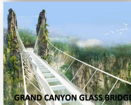
GRAND CANYON GLASS BRIDGE