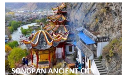
SONGPAN ANCIENT CITY