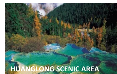
HUANGLONG SCENIC AREA