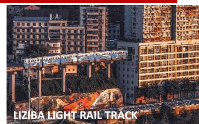
LIZIBA LIGHT RAIL TRACK