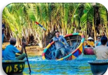
CAM THANH COCONUT VILLAGE

Setelah sarapan pagi di hotel, rombongan di transfer ke bandara untuk penerbangan kembali ke Medan transit di KUALA LUMPUR . Acara telah selesai sampai jumpa di tour berikutnya Bersama AMWTOUR .