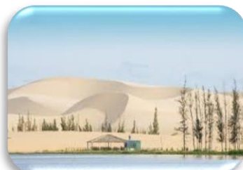
WHITE SAND DUNE