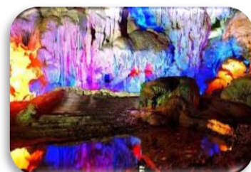
THIEN CUNG CAVE