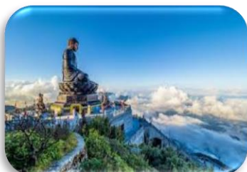
FANSIPAN PEAK MOUNTAIN