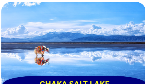
CHAKA SALT LAKE