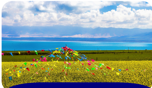
ERLANGJIAN SCENIC AREA

Pagi hari ini setelah sarapan pagi di hotel, transfer ke airport untuk penerbangan kembali ke Medan, dengan membawa sejuta kenangan indah bersama AMWTOUR.