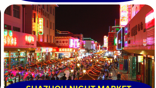
SHAZHOU NIGHT MARKET