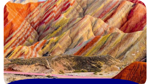
ZHANGYE NATIONAL GEOPARK