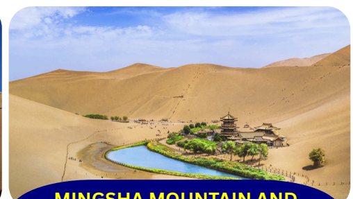
MINGSHA MOUNTAIN AND CRESCENT SPRING